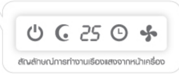
สัญลักษณ์การทำงานเครื่องแสดงจากหน้าเครื่อง